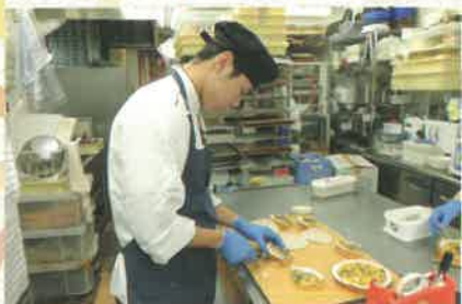
◎インターンシップ