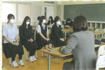
◎進路ガイダンス(就職)