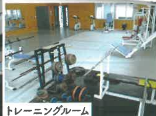
トレーニングルーム