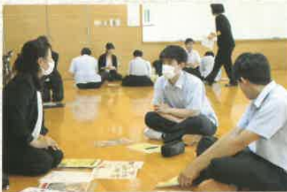
◎進路ガイダンス(進学)