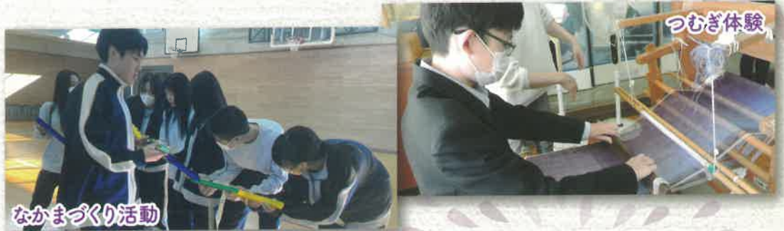
自彊スポーツフェスティバル